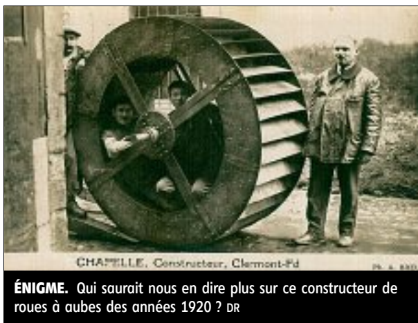
ÉNIGME. Qui saurait nous en dire plus sur ce constructeur de roues à aubes des années 1920 ?

La salle polyvalente de Châteaugay dans le Puy-de-Dôme accueillera au total soixante exposants – dont de nombreux professionnels – qui proposeront aux amateurs des dizaines de milliers de cartes postales anciennes. Au programme également de cette journée une exposition sur les commerces clermontois des années 1900 à 1920 présentée par un grand collectionneur auvergnat. Il nous proposera une balade au travers des rues de la capitale auvergnate, du centre ancien niché autour de la cathédrale jusqu'à Montferrand et retour par la place de Jaude et celle des Salins.